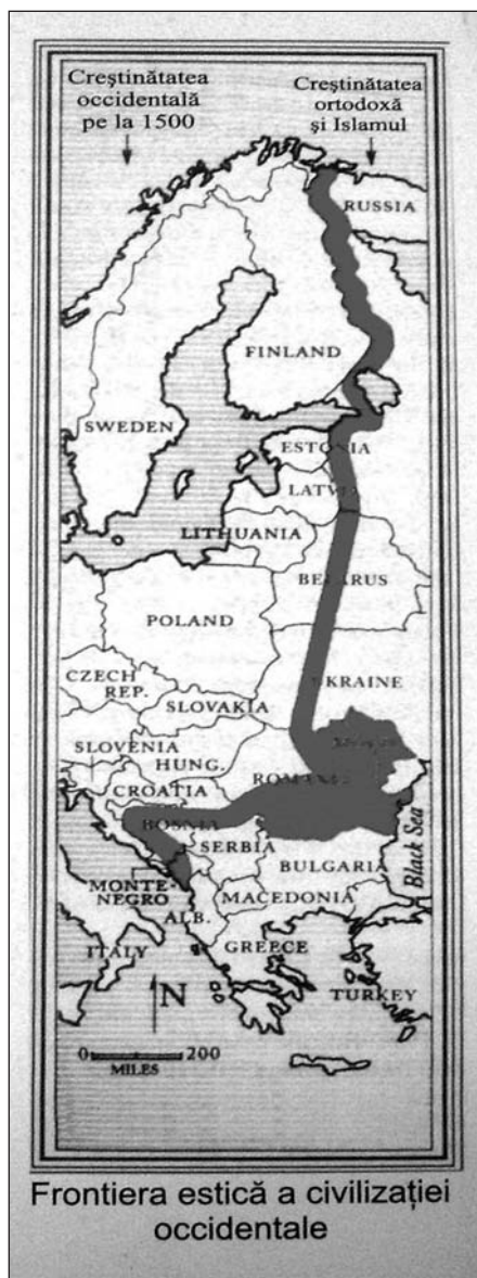
Frontiera etnică a civilizației occidentale